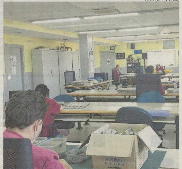
► Centro de día de Adispaz, en La Almunia de Doña Godina.

«Somos conscientes de que vivimos una emergencia social y, precisamente por ello, las administraciones públicas deberían garantizar las condiciones de atención a los colectivos más vulnerables. Y, desgraciadamente, esto no está ocurriendo», lamenta Santiago López, presidente de Plena inclusión España. «Nunca antes, en el más de medio siglo de historia de nuestro movimiento asociativo, habíamos vivido una situación