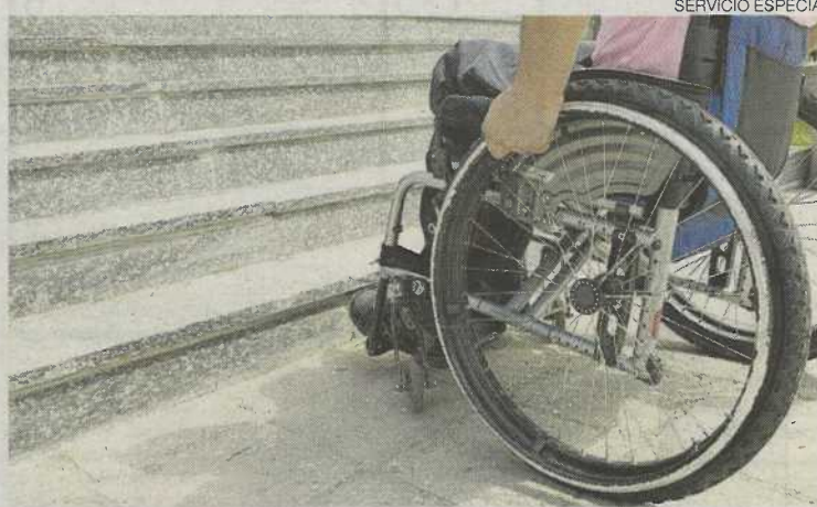
► El objetivo es lograr la accesibilidad universal.

Las dos primeras líneas de ayudas están dirigidas a Comunidades de Propietarios para obras relacionadas con la eficiencia energética, la accesibilidad y la eliminación de barreras arquitectónicas en los elementos comunes de los edificios, como la instalación de ascensores o rampas.