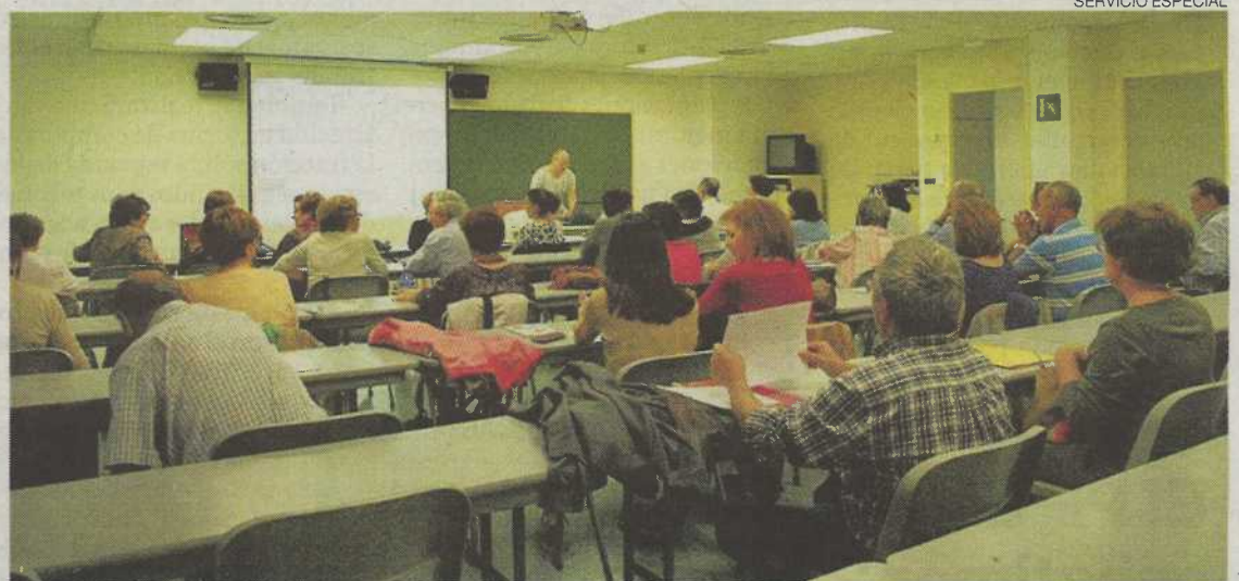
► Alumnos en el curso Una mirada al mundo en que vivimos el año pasado.

También es importante resaltar que en caso de retroceso de fase o confinamiento general o individual, los alumnos que hayan